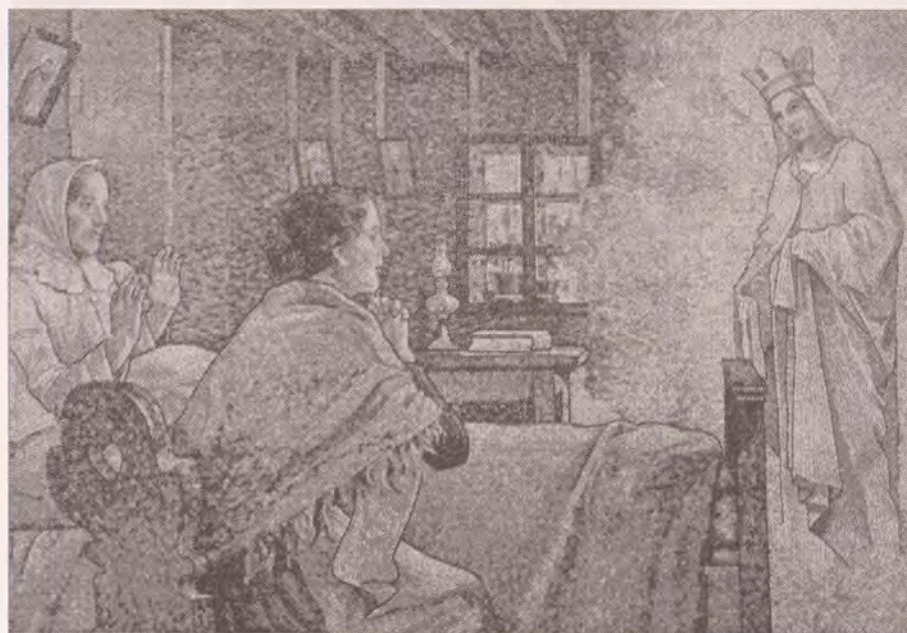
Mozaika z milostné kaple ve Filipově

(podle publikace Filipov - Philippsdorf 13.1. 1866)