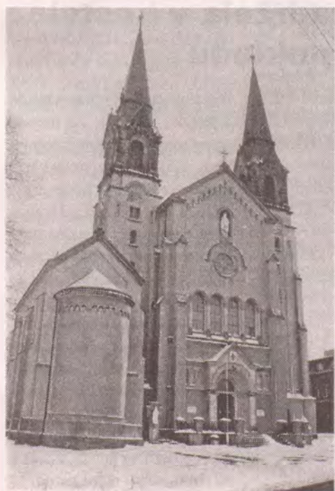
Bazilika Panny Marie ve Filipově

Saleziáni jsou tu vlastně poprvé. Předtím duchovní správu zajišťovali diecézní kněží, ovšem byli tu také redemptoristé v klášteře, který byl hned vedle baziliky. Poslední redemptoristé odešli kolem r. 1950. Po roce 1989 se kláštera zřekli ve prospěch diecéze, ovšem zůstal zatím domovem důchodců a ještě nejméně po deset let jím bude.