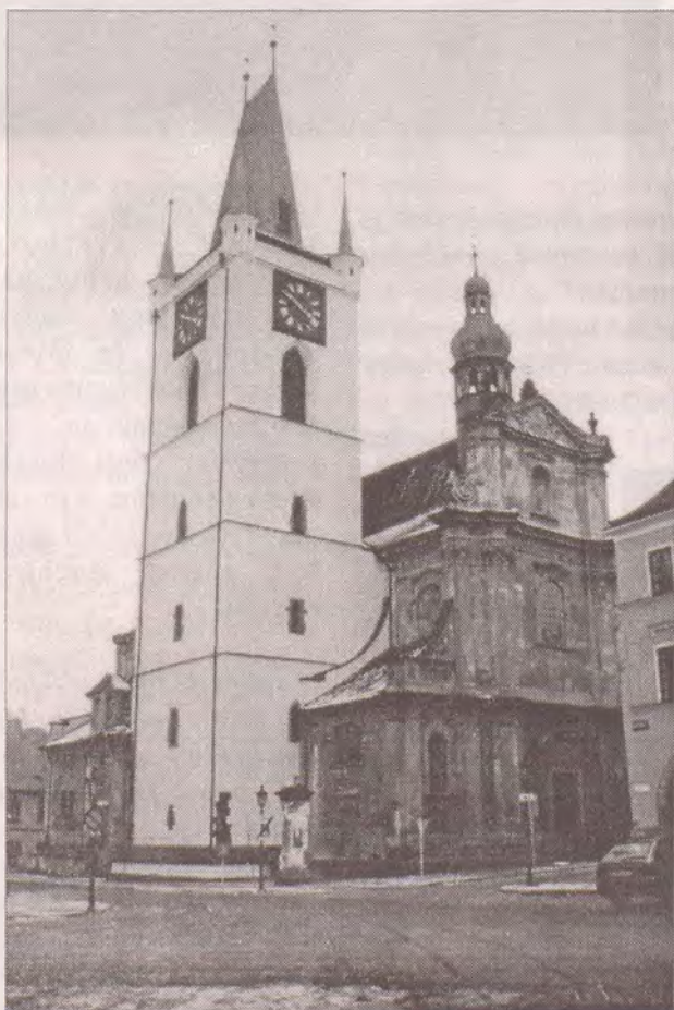
Kostel Všech svatých v Litoměřicích