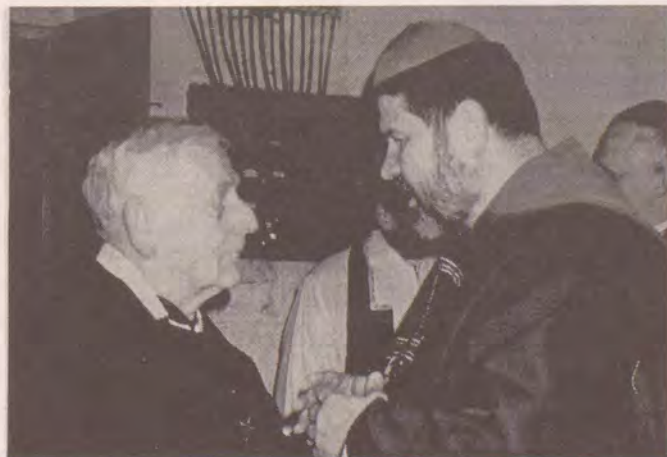
Biskup Jiří Paďour blahopřeje oslavenci