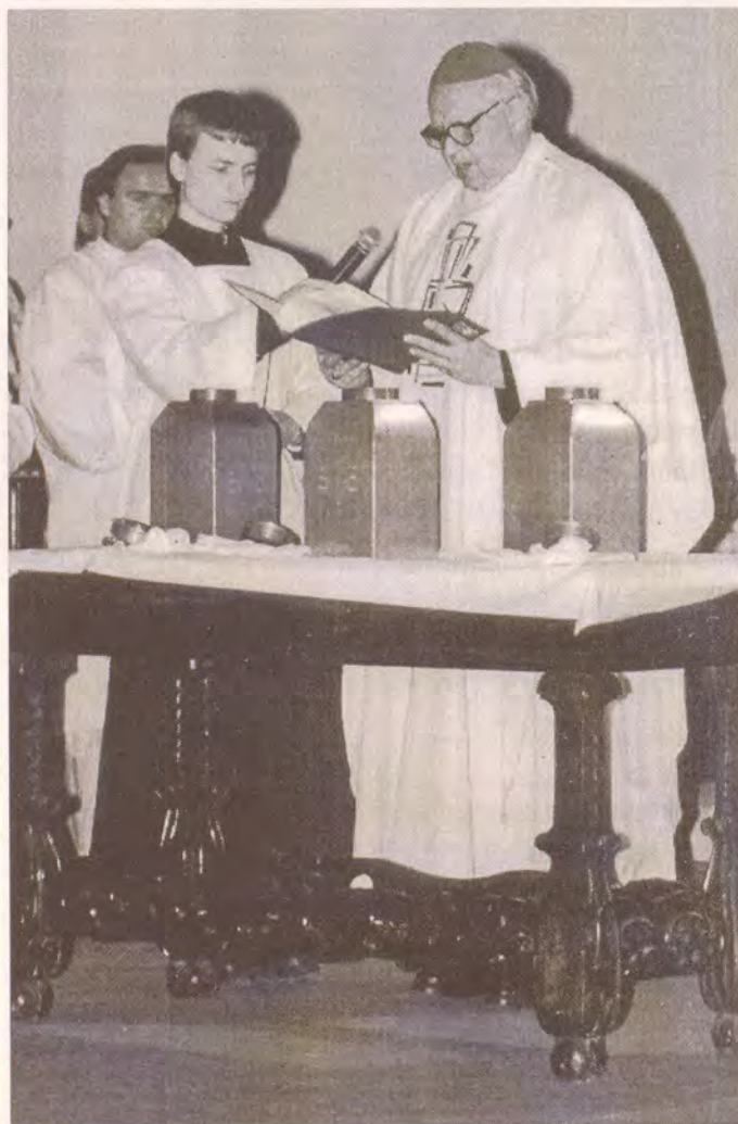
Otec biskup světlí oleje během kněžského dne v úterý Svátého týdne ve svatoštěpánské katedrále v Litoměřicích

ní svíce jeden za druhým přebírá světlo, které se rozlévá od jednoho k druhému, aby se po zvolání jáhna "Světlo Kristovo!" rozlilo toto světlo lodí kostela. Při třetím zvolání je kostel plný světla. Jáhen vyzvedne velikonoční svíci na svícen při ambonu, od kterého za chvíli zazní chvalozpěv na tuto svíci - symbol Zmrt-