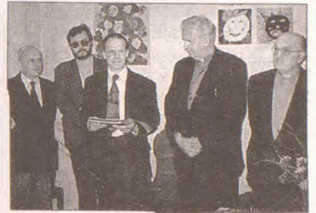
Otevření charitního Domu svatě Rodiny v České Kamenici