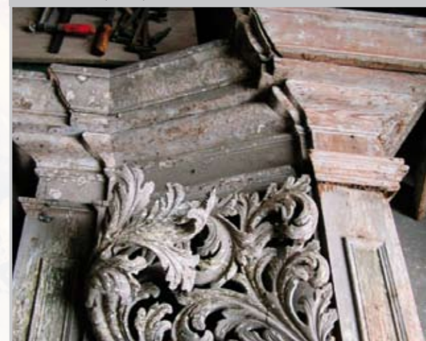
Poškozené dřevo prospektu varhan