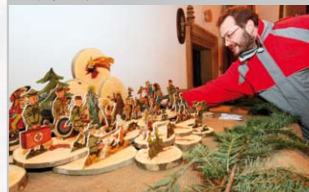
Skautský betlém, vyrobený ze dřeva a papíru.