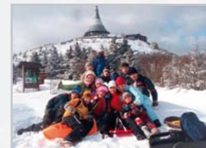
Bobování na Ještědu