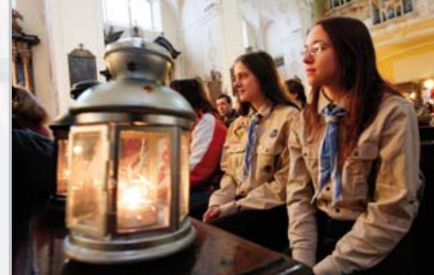
Betlémské světlo v katedrále sv. Štěpána.