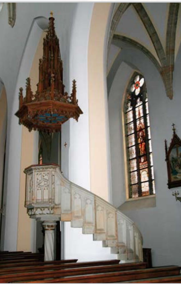
Kostel Narození Panny Marie Turnov