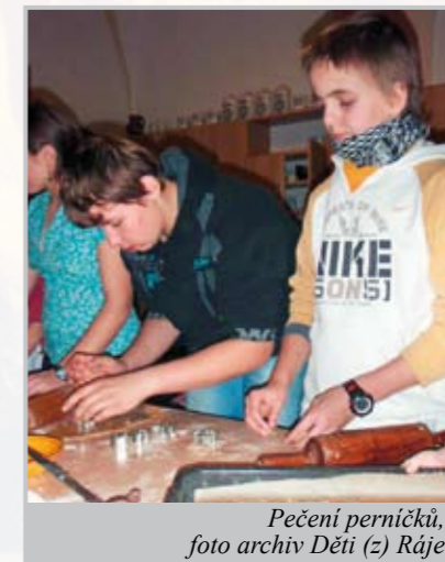
Pečení perníčků