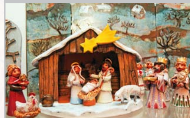
Další z betlémů vystavených v kostele Nanebevzetí P. Marie.