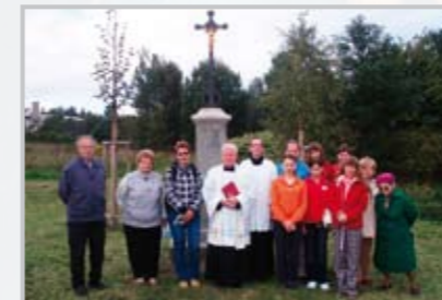
Farnost Jenišovice

Naše „parta“ vznikla kolem roku 1978, možná dříve, z popudu P. Petra Němce SDB, který byl v té době