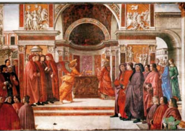
Anděl se Zachariášovi zjevuje v chrámě, Domenico Ghirlandaio z r. 1490

Samozřejmě ústřední postavou je Ježíš Kristus, který se vymyká jen lidské uchopitelnosti, na rozdíl od postav ostatních. Nový zákon v něm vyznává samotného Boha, Božího Syna. Ale i u Ježíše nalézáme charakteristické lidské vlastnosti, u kterých se můžeme zastavit. Vydejme se tedy po stopách významných osob, o kterých nám vypráví křesťanská část Bible.