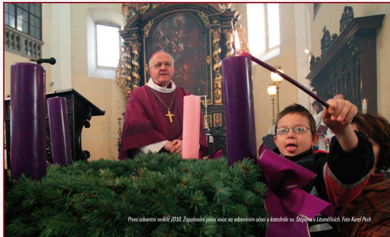
První adventní neděle 2010. Zapalování prvních svíček na adventním věnci v katedrále sv. Štěpána v Litoměřicích.