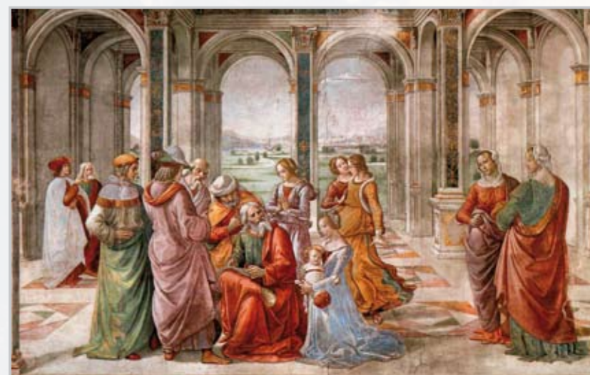
Zachariáš píše na tabulku jméno svého syna – Jan, Domenico Ghirlandaio z r. 1490