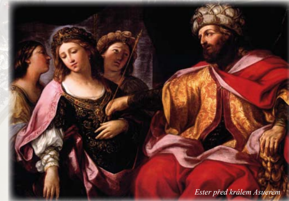
Ester před králem Asuerem

Los (hebrejsky „púr“) padl na 13. adar (poslední měsíc židovského kalendáře), což je přibližně první až druhý týden našeho března. Stejný den je povoleno novým ediktem vyhlazení všech nepřátel Židů. Má s nimi být naloženo stejně, jak se