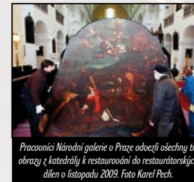
Pracovníci Národní galerie v Praze odvezli všechny tři obrazy z katedrály k restaurování do restaurátorských dílen v listopadu 2009.

Národní galerie v Praze – Sbirka starého umění, Biskupství litoměřické a Římskokatolická dómská farnost u sv. Štěpána v Litoměřicích pořádaly v květnu v katedrále sv. Štěpána při příležitosti představení podzimní pražské výstavy NG „Karel Škréta: 1610 – 1674: Doba a dílo“, na níž biskupství zapůjčilo tři malířovy obrazy z jeho litoměřické série, setkání odborníků s novináři. Jeho obsahem byla nová zjištění ke Škrétovým litoměřickým plátnům, především k hlavnímu oltářnímu obrazu Ukamenování sv. Štěpána.