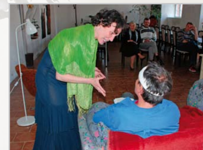
Manželé Spalovi při zkoušce divadelního představení Manželské vraždění.

Tof Toda je volné sdružení hudebníků, kteří čas od času opouštějí svou operní, pedagogickou a další praxi, aby se společně věnovali interpretaci hebrejských písní.