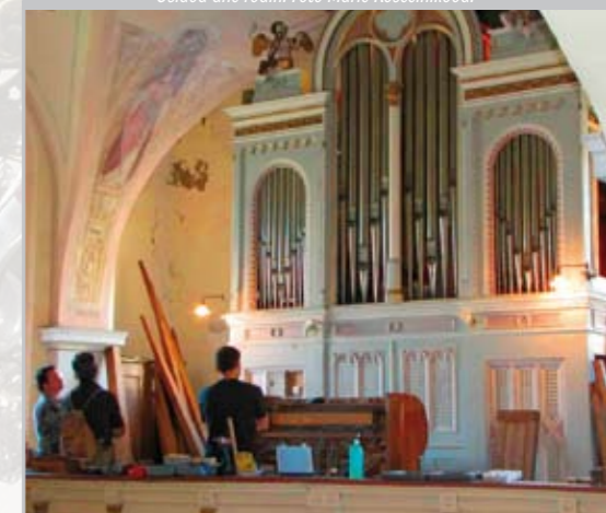
Varhany, Rumburk.