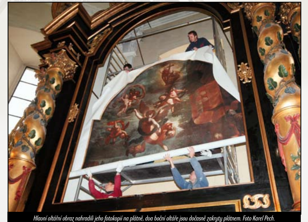
Hlavní oltářní obraz nahradili jeho fotokopii na plátně, dva boční oltáře jsou dočasně zakryty plátnem.