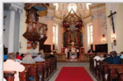
Zahájení poutní sezony v Jablonném, mše sv. 1. května 2010.

ném v Podještědí a spolupracovnice dominikánů v Jablonném a Turnově, kterou před patnácti lety prohlásil pa-