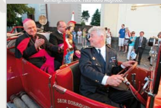
Po Floriánské mši svaté.