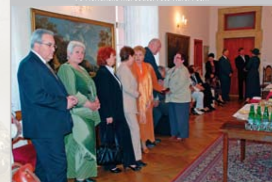
Setkání biskupa se starosty.