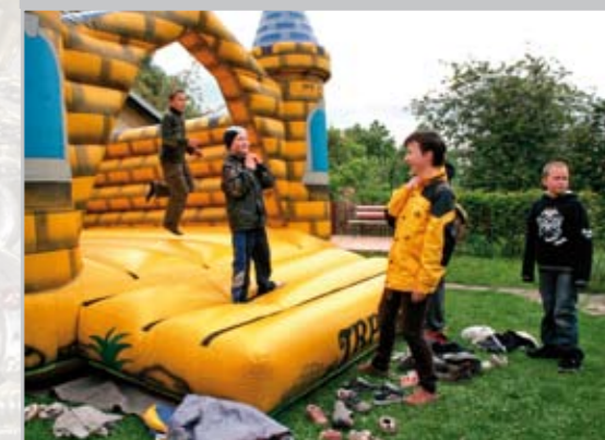
Oslava dne rodin. Foto Marie Koscelníkové.