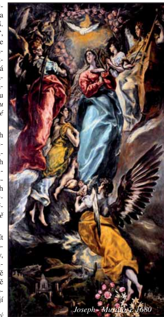
Joseph - Murrillo, r. 1680