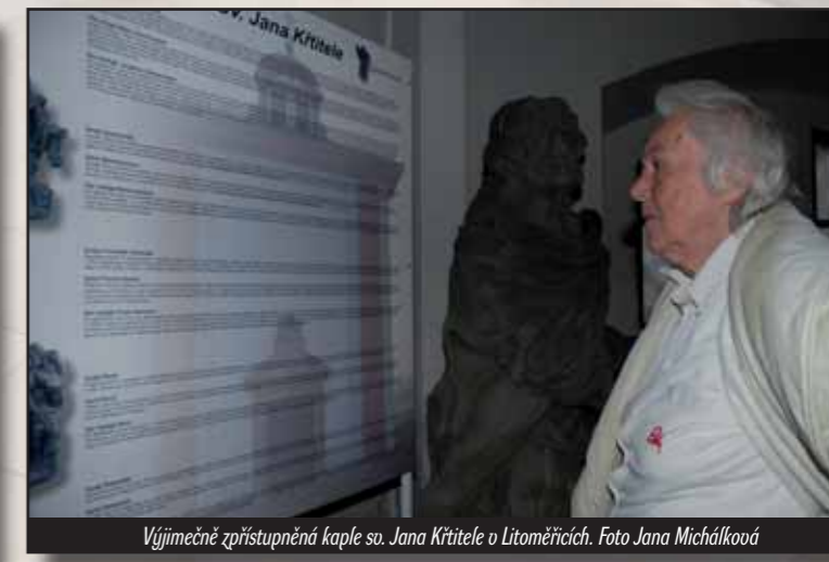
Výjimečně zpřístupněná kaple so. Jana Křtitele v Litoměřicích.