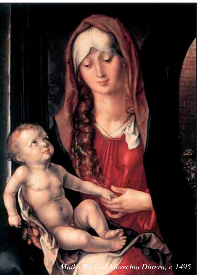
Matka Boží od Albrechta Dürera, r. 1495