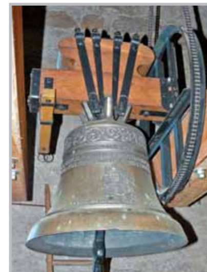
Takto „pěkně“ vypadá elektrický stroj v památné zvonici.

o tom, jak se chovat. Výsledek se dostavil. Když zvoníci skončili a zvony ještě doznívaly, ihned se rozpovídala o svých dojmech. Nejstarší a hlavní zvoník se rozčílil a pronesl větu: „Kdo nemá v sobě tolik slušnosti, aby v tichosti poslouchal modlitbu zvonů do konce, a začne do ní kecat, nemá tady co dělat! Odejděte!“