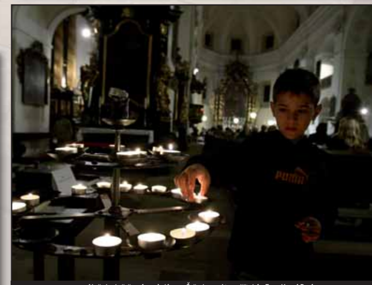
Noční návštěva katedrály so. Štěpána v Litoměřicích.