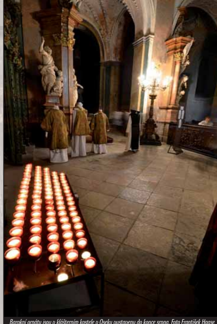
Barokní ornaty jsou v klášterním kostele v Oseku vystaveny do konce srpna.