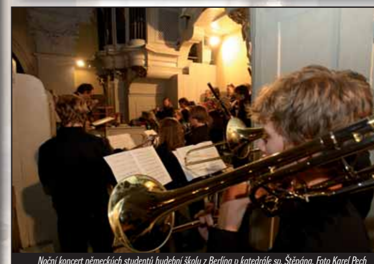
Noční koncert německých studentů hudební školy z Berlína v katedrále so. Štěpána.