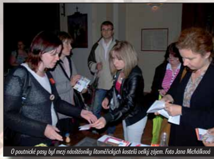
O poutnické pasy byl mezi náušťovníky litoměřických kostelů velký zájem.