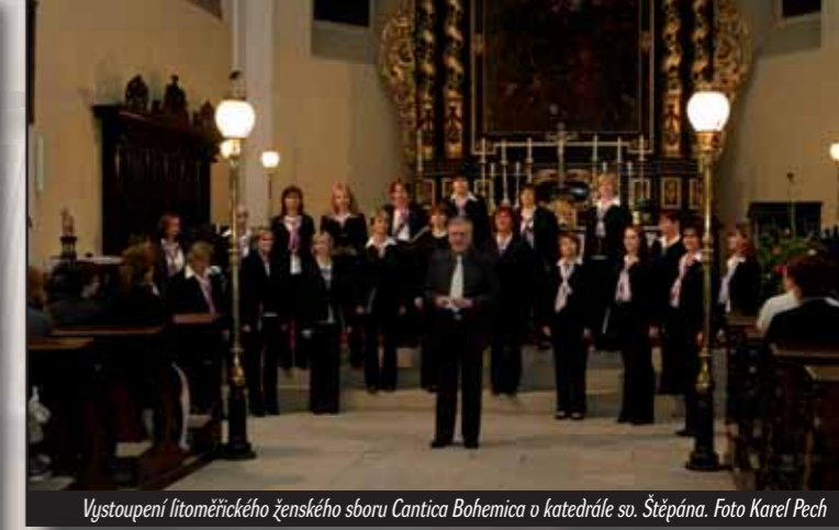
Vystoupení litoměřického ženského sboru Cantica Bohemica v katedrále so. Štěpána.