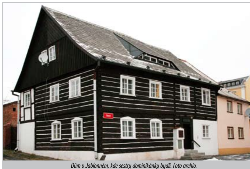
Dům v Jablonném, kde sestry dominikánky bydlí.

člověka chce přivést k sobě a nezáleží na tom, čím ho provede. Někdy je pro nás těžké přesvědčit