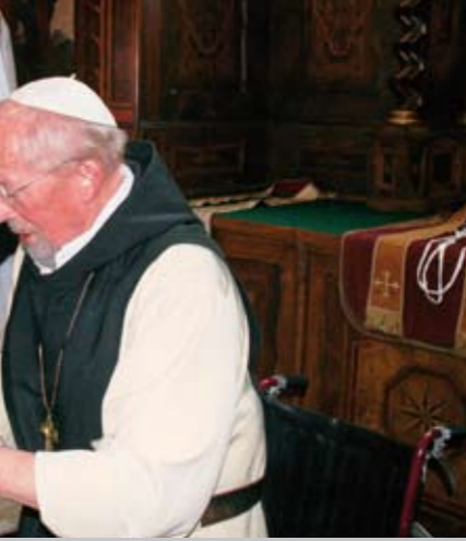
Setkání litoměřického biskupa Jana Baxanta a oseckého opata Bernharda Thebese.

Opat měl smysl pro ekumenismus mezi křesťany různých vyznání. Sám měl z rodiny dobré zkušenosti v soužití katolíků a evangelíků - otec byl evangelík a matka katolička. Proto i rád spolupracoval se skutečně věřícími evangelíky v Německu. Z nich někteří, zejména na saské straně Krušných hor, též podporovali klášter Osek.