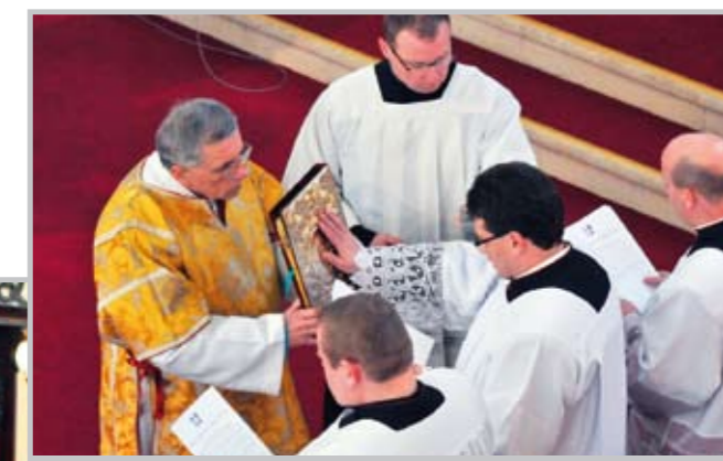
Společná přísaha, při níž se kanovníci dotýkají Písma svatého.