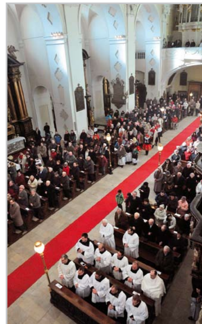
Zaplněná litoměřická katedrála přihlíží slavnostnímu obřadu.

vstupné - rodiče s dětmi do 15 let (2 dospělí a 1-5 dětí): 300 Kč