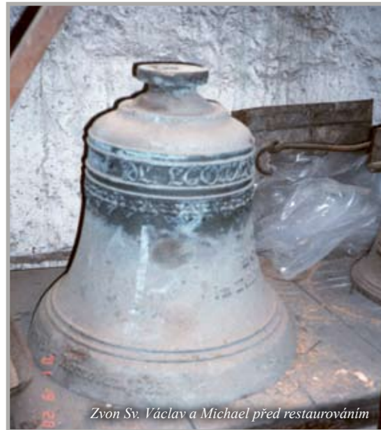
Zvon Sv. Václav a Michael před restaurováním

fungoval tak, že byl zavěšený staticky a tlouklo do něho kladivo. Když jsme chtěli někomu dobře zazvonit, bili jsme srdcem zvonu ručně. Pak jsme si řekli, že musíme udělat projekt. Švagr mi to posoudil staticky, já jsem