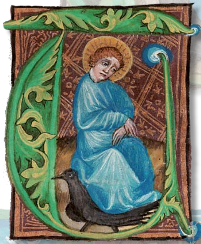
Sv. Jan Evangelista