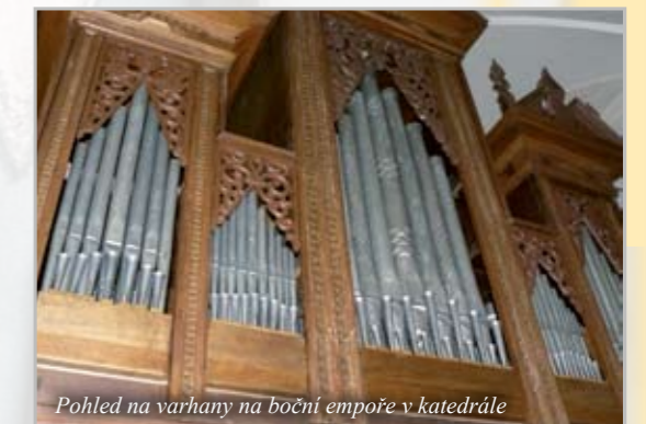
Pohled na varhany na boční emporě v katedrále