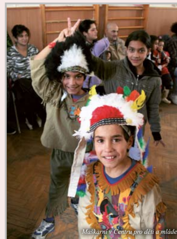
Maškarní v Centru pro děti a mládež

Centrum pro děti a mládež je zařízení, které poskytuje prostor pro trávení volného času dětem a mládeži ve