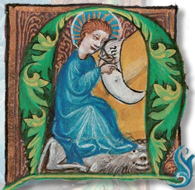
Sv. Marek Evangelista