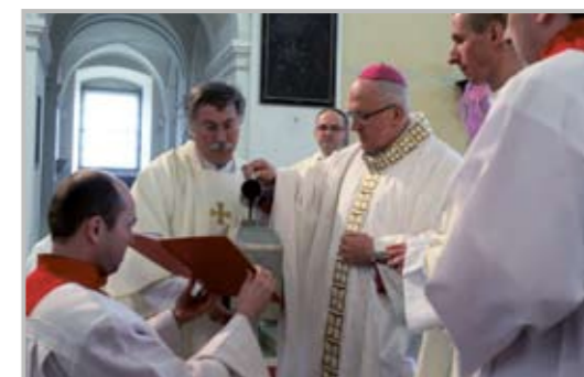
Kněžský den v Litoměřicích, 9. 5. 2012