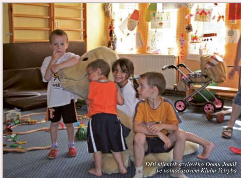
Děti klientek azylového Domu Jonáš ve volnočasovém Klubu Velryba

Jedním ze zařízení FCH Česká Lípa je Dům Jonáš – azylový dům pro matky s dětmi v tísní, jehož sídlo naleznete na adrese Dubická 2189, Česká Lípa.