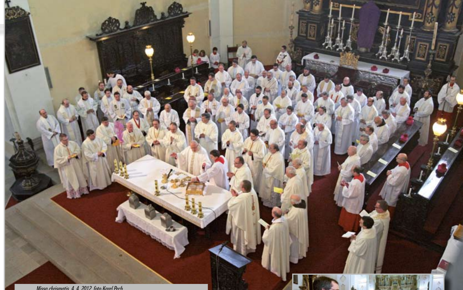
Missa chrismatis, 4. 4. 2012

Uzávěrka je vždy k 8. dni v měsíci. V roce 2012 vyjde deset čísel. Jedno číslo stojí 20 Kč.