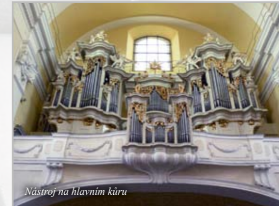
Nástroj na hlavním kůru

Katedrála sv. Štěpána s nezaměnitelnou štíhlou zvonnicí je charakteristickou dominantou biskupského sídelního města Litoměřic a snad je u nás málo těch, kteří by ji nedoká-