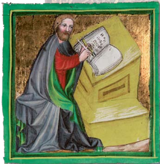
Sv. Matouš Evangelista

nejstarší zachovaný úplný rukopis bible u nás. Původně z biskupské knihovny v Litoměřicích, nyní deponována ve Státním oblastním archivu v Litoměřicích. Illuminace evangelistů Matouše, Marka, Lukáše a Jana.