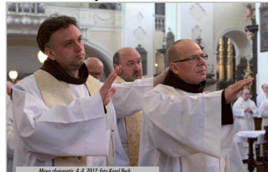
Missa chrismatis, 4. 4. 2012