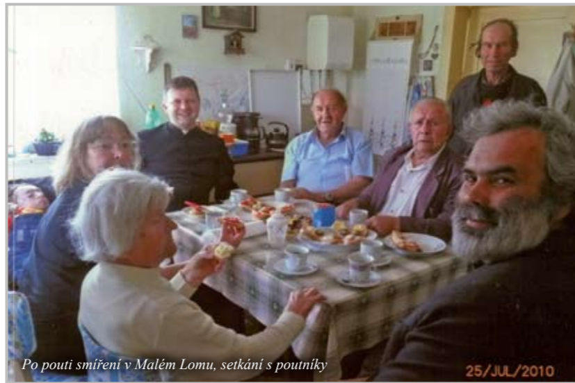
Po pouti smíření v Malém Lomu, setkání s poutníky 25./JUL./2010

„Litvínovské zvony byly zničeny za války. V bočním vstupu kostela byl dlouho uložený velký zvon zachráněný z Kopist. V osmdesátém roce naši Poláci navrhli zavěsit jej do věže, jenže nosná stolice byla těžce poškozená. Nějaký čas proto zvon