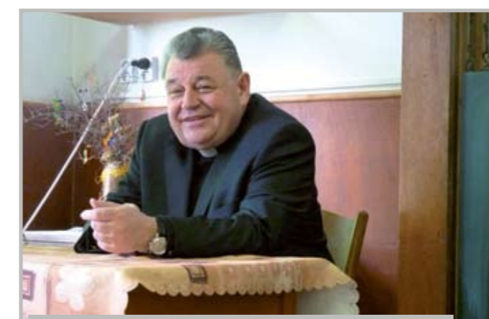
Host kněžského dne Dominik kardinál Duka OP