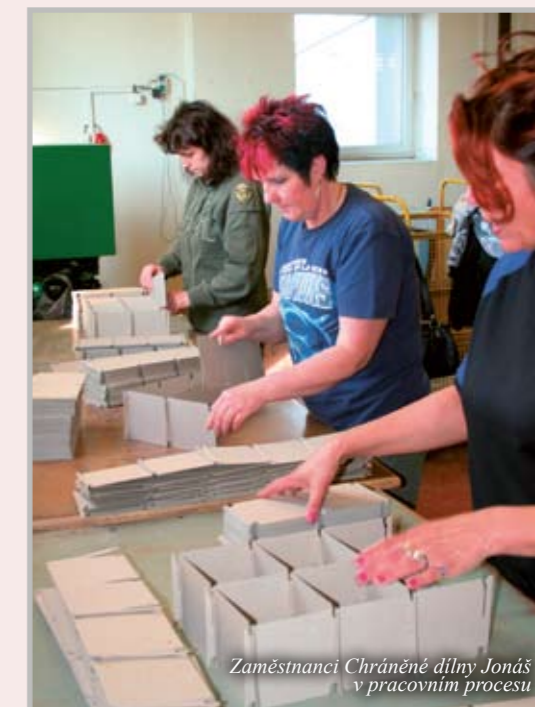
Zaměstnanci Chráněné dílny Jonáš v pracovním procesu