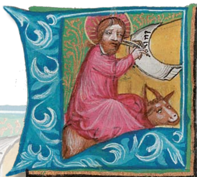
Sv. Lukáš Evangelista