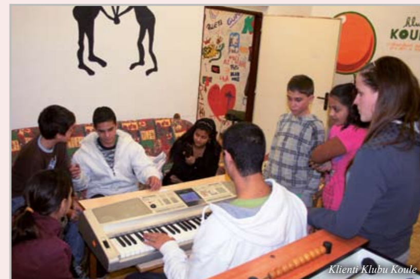
Klienti Klubu Koule

Klub Koule je nízkoprahové zařízení pro děti a mládež ve věku od 15 do 26 let a navazuje na Centrum pro děti