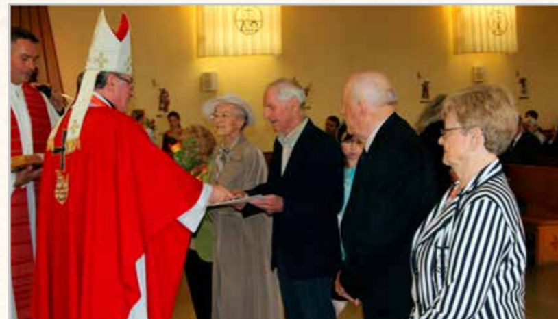
Předávání medailí zaslužilým farníkům (23. 9. 2012)

Vzpomínám si, že při prvním setkání kněží, kteří působí mezi