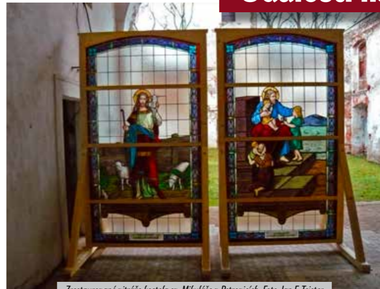
Zrestaurované vitráže kostela sv. Mikuláše v Petrovích.

Fotogalerie ke zprávám na straně 14 - 15