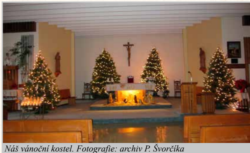
Náš vánoční kostel.

Církev Kristova je všude stejná, v Kanadě si to mohu více uvědomovat a prožívat. Církev je tvořena lidmi, kteří mají stejné radosti i bolesti, stejné chyby, stejné dary... Je pravda, že církev v Torontu je skutečně pestrobarevná. Říká se, že torontská arcidiecéze je nejvíce multikulturní diecézí na světě. Každou nedě-