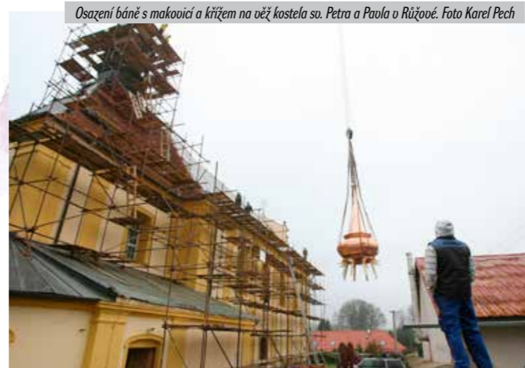
Osazení bání s makovicí a křížem na věž kostela sv. Petra a Paola v Růžové.