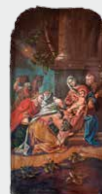
Fotografie na titulní straně časopisu: Klanění tří králů (olej na plátně, konec 18. stol., ze sbírek diecéze)