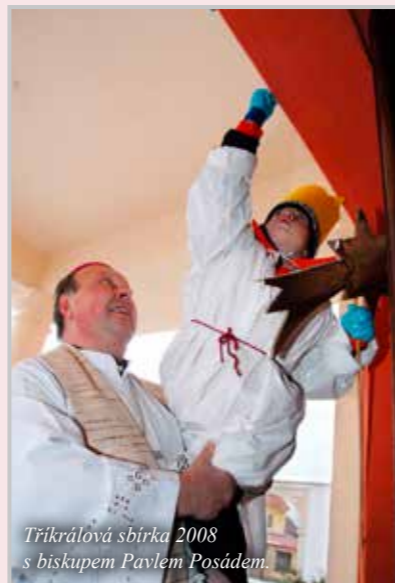
Tříkrálová sbírka 2008 s biskupem Pavlem Posádem.

Stále však není pokryto celé území litoměřické diecéze, proto je pomoc na přípravách či organizaci Tříkrálové sbírky vždy vítaná.