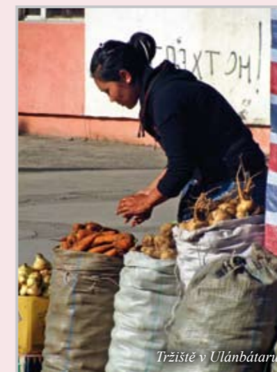
Tržišťe v Ulánbátaru

vána síť vzdělávání prostřednictvím radiotechnických prostředků, kdy děti mohly první roky školní docházky absolvovat dálkově a vzdělávat se prostřednictvím radiového spojení s profesionálním učitelem.