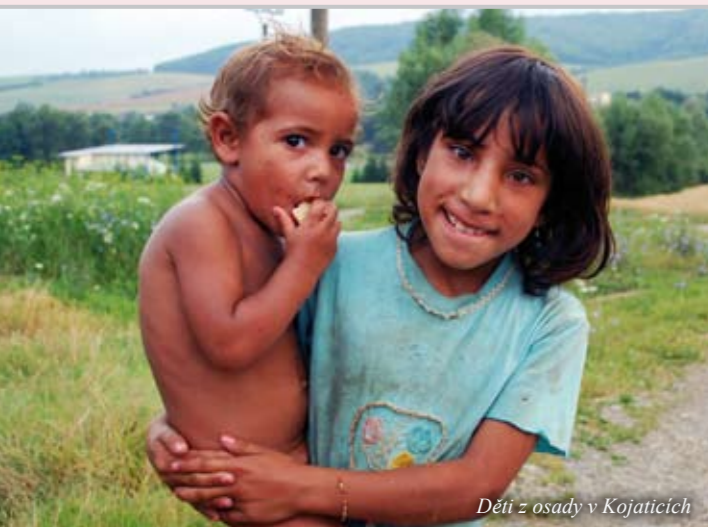
Děti z osady v Kojaticích

Diecézní charita Litoměřice je již tradičně chápána jako organizace, která poskytuje služby trpícím a potřebným lidem zejména na úrovni farností, obcí či měst v litoměřické diecézi. O něco méně jsou však v obecném povědomí informace o pomoci, kterou Diecézní charita Litoměřice poskytuje za hranicemi České republiky. Rádi bychom tedy prostřednictvím časopisu Zdislava splatili náš dluh a představili čtenářům aktivity, které Diecézní charita Litoměřice realizuje v zahraničí.