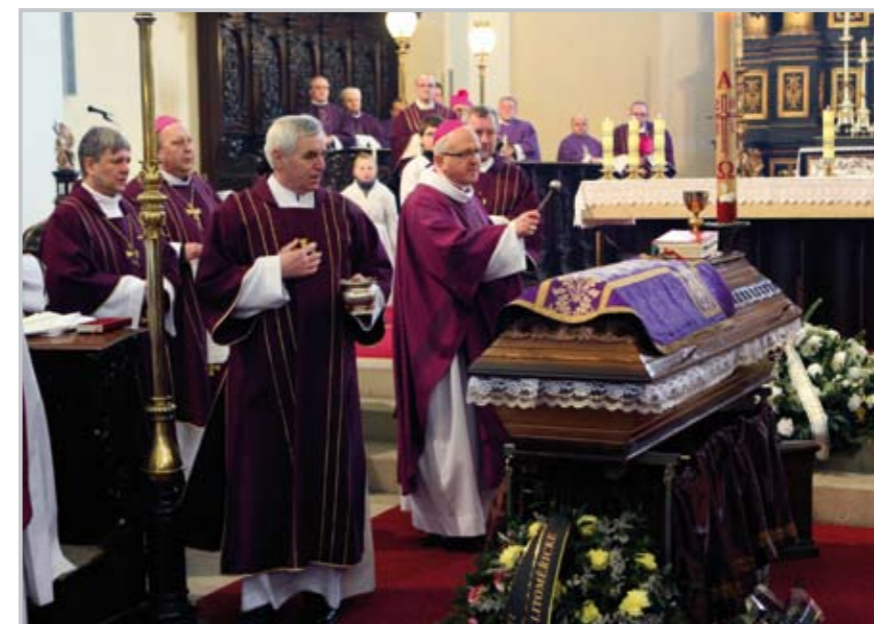
24. 2. 2012, Litoměřice • Více na straně 6-9 •