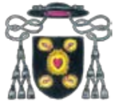
Znázornění Kristových ran v osobním znaku probošta kapituly jako symbol Kristovy oběti a současně jeho vzkříšení.

Na Bílou sobotu slyšíme zpívat exultet. Je to zpěv o vzkříšení, zpěv o velikonoční svíci, která symbolizuje Krista. V tomto chvalozpěvu se také připomíná dědičná vina prvních lidí. Člověk svou vlastní neposlušností na sebe uvalil to nejhorší, co mohlo být – ztrátu života věčného. O Velikonocích si připomínáme, že tuto ztrátu nahradil svou vykupitelskou obětí Ježíš Kristus. Svätý Pavel hovoří o „pošetilosti Boží lásky“ k nám, lidem. Začíná to právě Velikonocemi: Bůh se stal člověkem, přijal lidské tělo - to je první akt této Boží lásky. To už samo o sobě znamená ponížení Boží, láskyplné snížení Boha k člověku. Možná, že by to samo o sobě stačilo ke spáse. Tak to píše i svätý Tomáš Akvinský. Ovšem Pán Ježíš šel do krajnosti a byl poslušný Otce až k smrti, a to smrti na kříži.