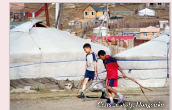
Cesta ze školy, Mongolsko

Jiným palčivým problémem porevoluční doby byla situace bezdětných seniorů, lidí s tělesným hendikepem, či duševním onemocněním.