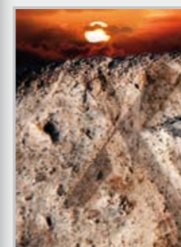
Fotografie bez uvvedení autora Jana Michálková a Miroslav Zelenka