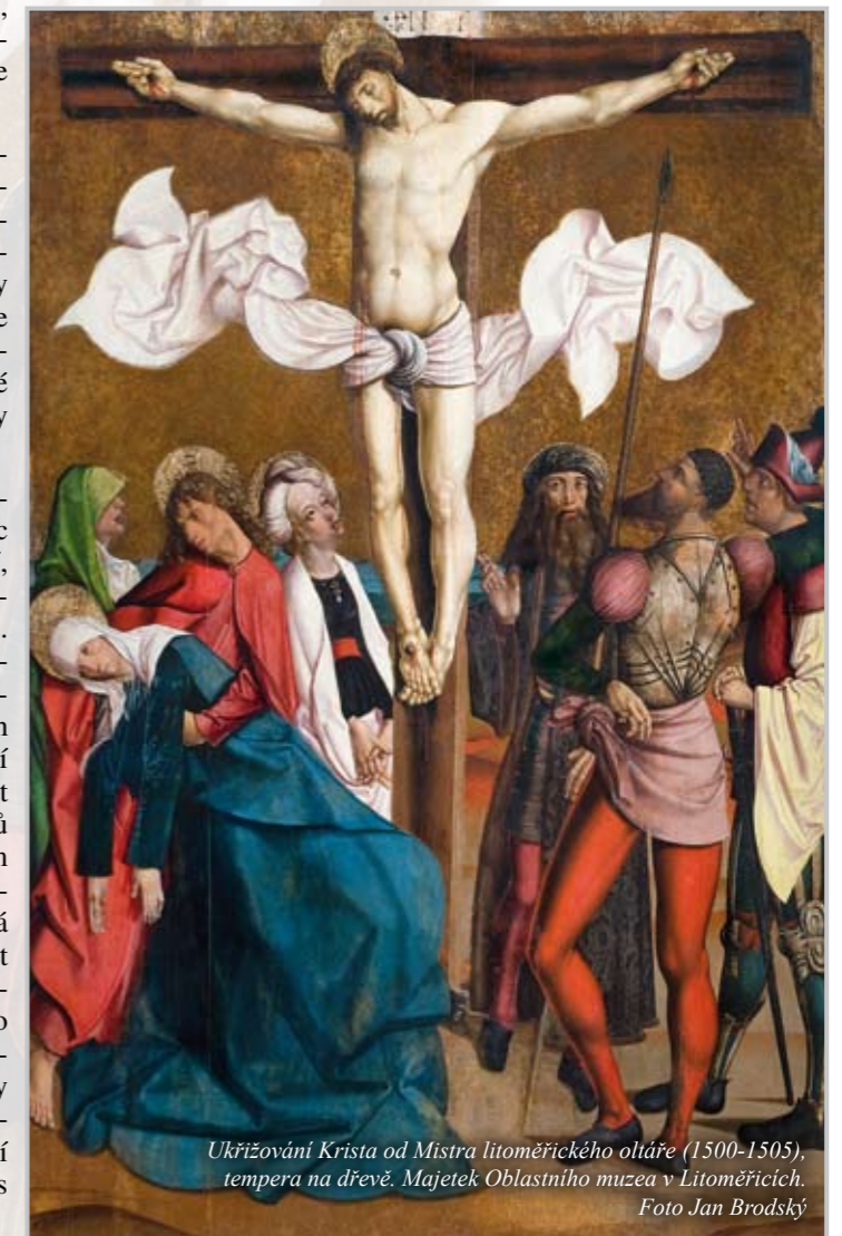
Ukřižování Krista od Mistra litoměřického oltáře (1500-1505), tempera na dřevě. Majetek Oblastního muzea v Litoměřicích.

Jelikož různost aktivit naší farnosti je