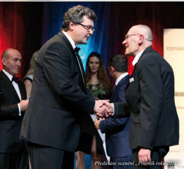
Předávání ocenění „Právník roku 2011“