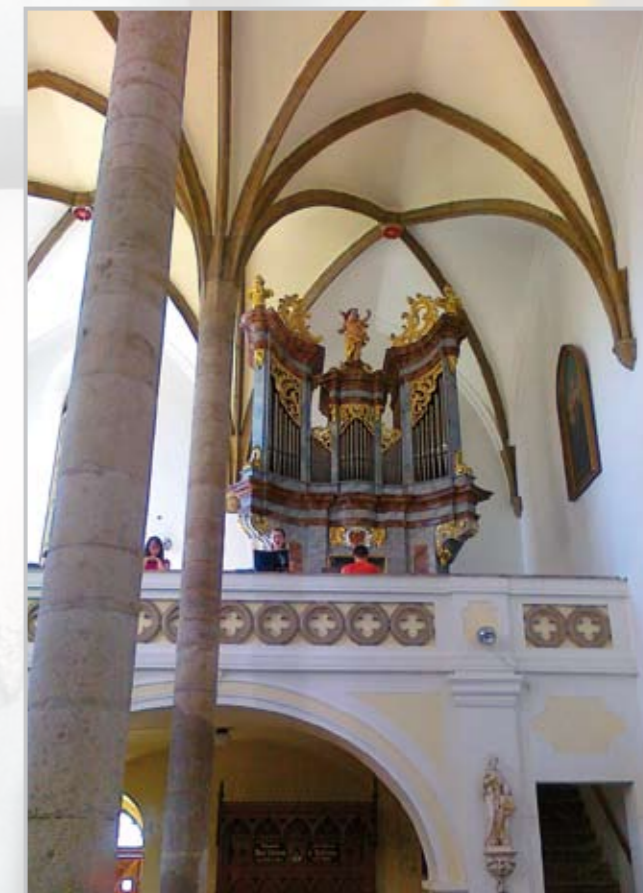
Varhany v kostele sv. Víta v Soběslavi převezené z kostela v Malém Březně u Mostu.