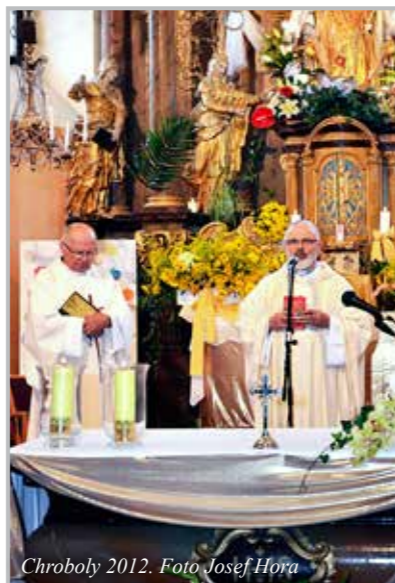
Chroboly 2012.

vyvážená. To se pozná na síle odpovědí Božího lidu při mši svaté. V poslední době jsem si zvykl modlit se Otčenáš v obou jazycích. Lidé to přivítali. Někteří hovoří česky i německy a jsou rádi, když se mohou Otčenáš modlit stejně jako přátelé z druhého etnika.