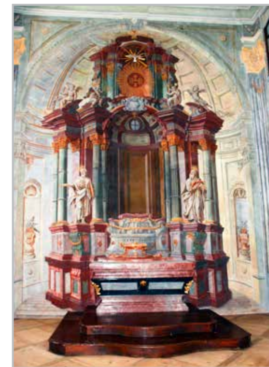
Kaple sv. Vavřince v biskupské rezidenci v Litoměřicích, stav před restaurováním v roce 2009 a stav po restaurování v roce 2012