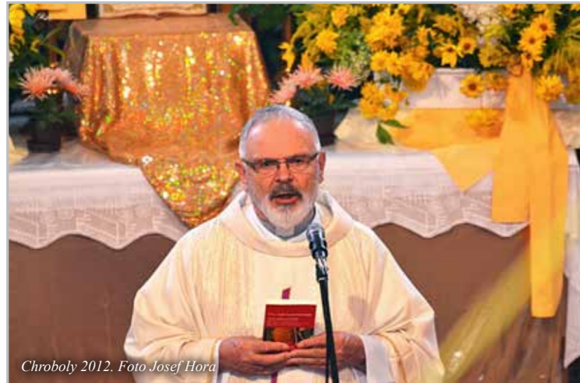
Chroboly 2012.