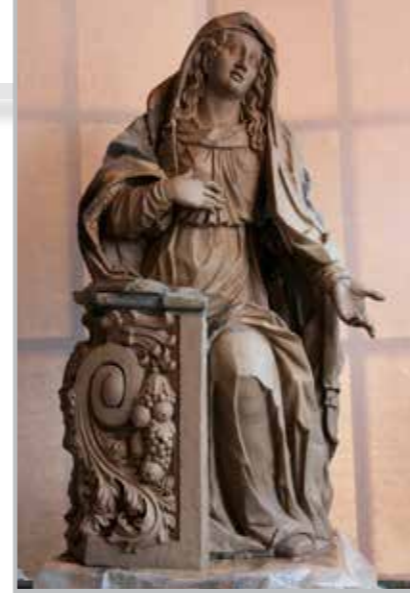
model pro sekanou kopii

Za obsah časopisu odpovídá P. Stanislav Příbyl ( pribyl@dltm.cz ). Redakce: Jana Michálová ( michalkova@dltm.cz ), Hana Klára Němečková ( nemeckova@dltm.cz ). Grafická úprava: Miroslav Zelenka. Tisk: Tiskárna PRIMA, s.r.o. ( zelenka@primatisk.net ). Objednávky a distribuce zajišťuje Vydavatelství IN, s.r.o. ( zdislava@in.cz ), tel. 775 598 604 prostřednictvím Postservisu. Nevýžadané příspěvky nevracíme. Redakce si vyhrazuje právo na zkrácení příspěvků. Registrace MKČR E7397. ISSN 1211-3042.