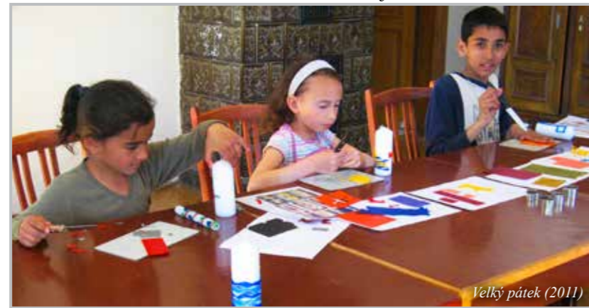
Velký pátek (2011)

nepotřebovali se začlenit do většinové společnosti, chodit na náboženství ani zpívat v kostele, chtěli hlavně peníze, jídlo nebo odvézt někde autem. Když se nechtěl nechat využívat, nastal konflikt.