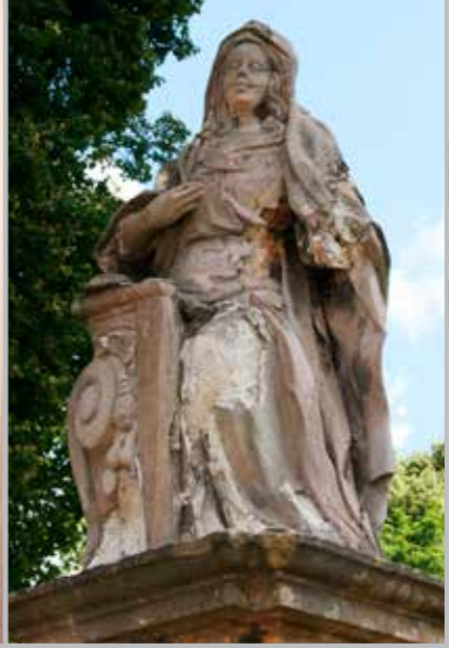
původní stav sochy