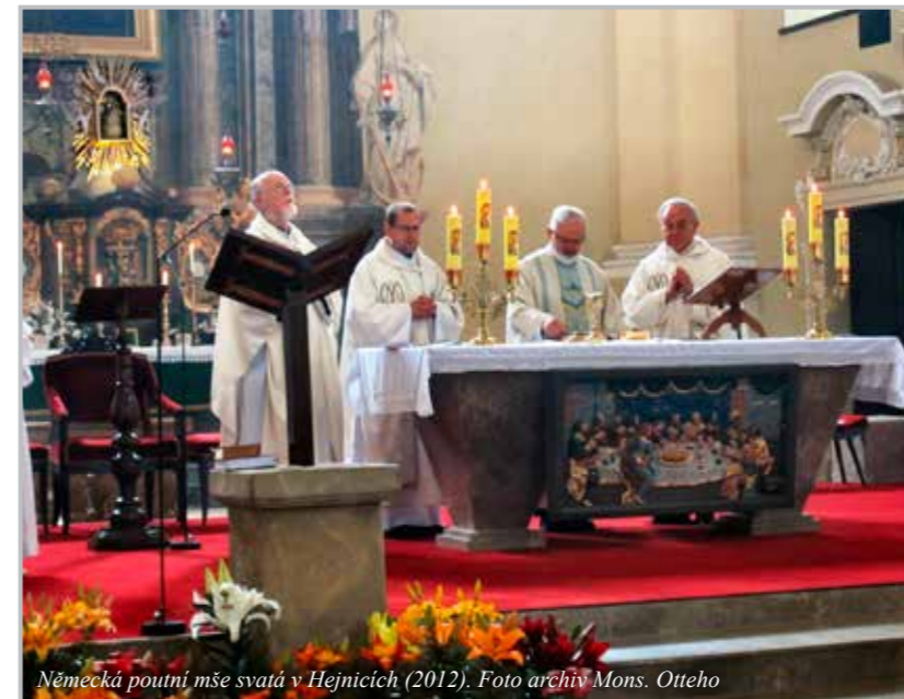
Německá poutní mše svatá v Hejnicích (2012).