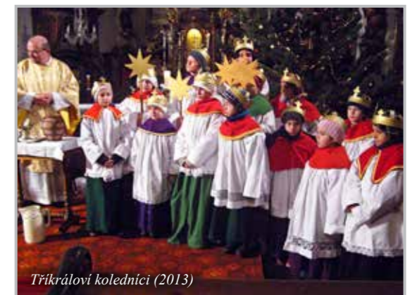
Tříkráloví koledníci (2013)

Farnost komunikuje s německými farnostmi. Pěstuje se pravidelná přeshraniční spolupráce s katolickou farností Schirgiswalde a evangelickou farností v Großpostwitz a Sohländ. Jedná se o společné kulturní