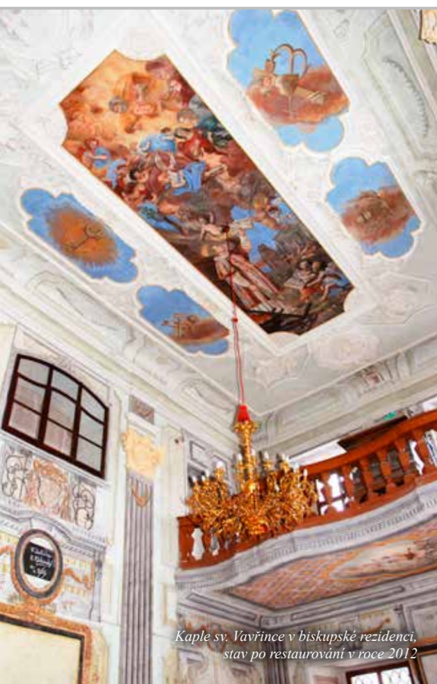
Kaple sv. Vavřince v biskupské rezidenci, stav po restaurování v roce 2012