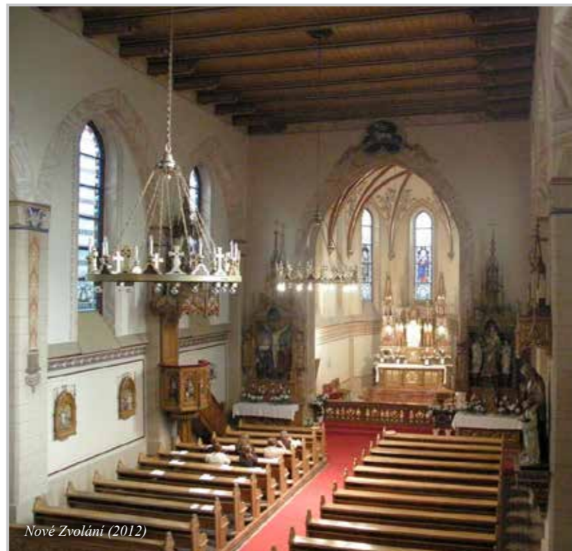
Nové Zvolání (2012)

Dříve zde bylo sídlo proslulé továrny na výrobu čerpadel a hasicí techniky Flader, která dávala práci mnoha místním horalům. V roce 1930 měl Pleil (tak se mu říkalo za Němců) 762 obyvatel. Dnes tu zbylo pár domků. Kostel sv. Antonína je nově opraven zvenku i zevnitř. Farnost by zde ráda založila novou tradici, malé poutní místo. Každý měsíc v okolí 13. dne, na který v červnu připadá svátek sv. Antonína, se zde koná od 17 hodin pobožnost a po ní mše svatá. Vloni o pouti, při příležitosti 10. výročí opravy kostela, si farnost zapůjčila vzácnou relikvii patrona kostela. Poprvé a zřejmě nikoliv naposledy.