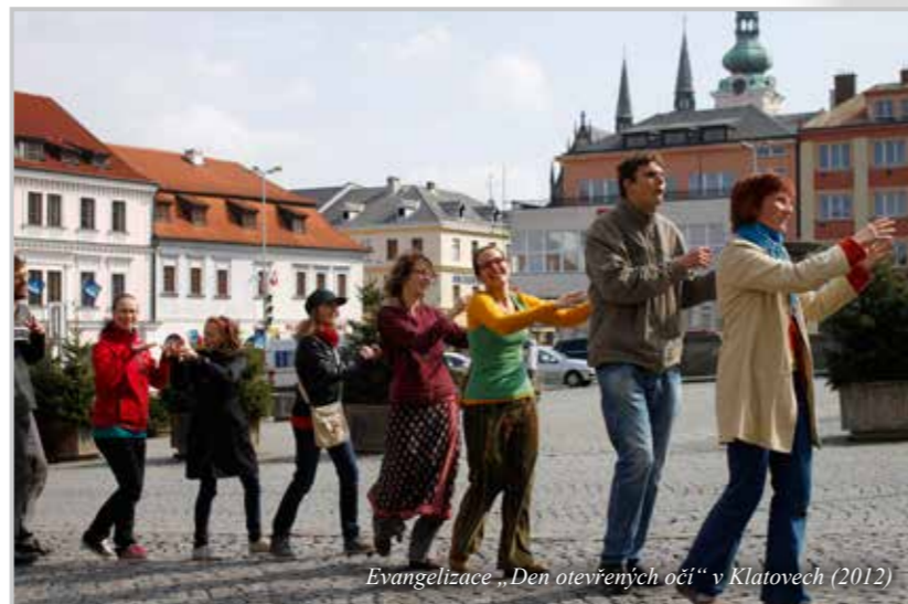
Evangelizace „Den otevřených očí“ v Klatovech (2012)

Další věc, chození dveře od dveří, jak se to dělá a jak se přistupuje k lidem, máme od italského hnutí Alfa-Omega, které mělo asi pětadvacetiprocentní úspěšnost, to znamená, že každá čtvrtá domácnost je pozvala domů na návštěvu. Nám se to pohybuje někde mezi deseti a dvaceti procenty.