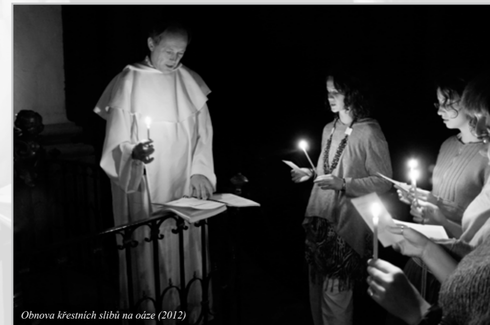
Obnova křesťanských slibů na oáze (2012)

Když jsem byl v devadesátém třetím na jaře převelen do severních Čech, začali jsme s oázou postupně zkoušet výpravy po dvojicích za lidmi: o prázdninách jsme poprvé zkusili projít vesnici dveře od dveří. První pokus se nám velice zalíbil, tak jsme pokračovali dál. První obec, kterou jsme prošli, byly Řehlovice u Ústí nad