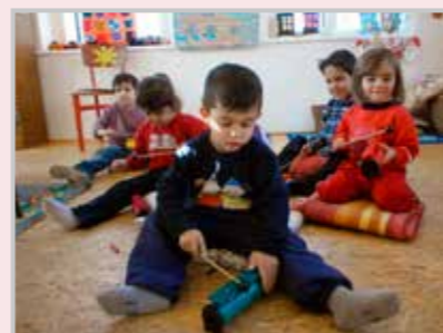
Děti z Předškolního klubu.

Významnou předností Předškolního klubu je malá skupinka žáků (max. 10 dětí). Sociální pracovníce tak může lépe naplňovat individuální potřeby jednotlivých žáků, což je pro děti z často sociálně nepodnětného prostředí velmi důležité. Předškolní klub je bezplatný, pro děti je připravena svačina a pití po celou dobu návštěvy.