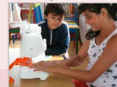
Šití na stroji je velmi oblíbené.

„Na začátku naší činnosti nám nebyly poskytnuty žádné veřejné prostředky. Kromě Předškolního klubu, který je podpořen z MŠMT z programu na integraci romské komunity, jsme všechny akce, zaměstnance, realizaci nezbytného ústředního vytápění a další náklady hradili z podpory organizací Renovabis, Ackermann-Gemeinde a mnoha velkorysých soukromých dárců. Vám všem za to patří veliký dík,“ uzavírá paní ředitelka.