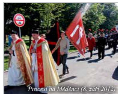
Procesi na Měděnci (8. září 2012)

jezdila koncertovat téměř po celém světě, sláva Přísečnice byla veliká. Když se hudebníci vraceli domů, třeba po několika letech, přiváželi s sebou různé věci, i z dalekých krajín. Kostelu v Přísečnici věnovali kroupenku z obrovské mušle, podobné můžete dodnes vidět v Černém Potoce a Kryštofových Hamrech.