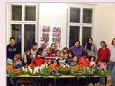
Výroba adventních věnců.

Pokud má být práce s dětmi efektivní, je nezbytná i práce s rodiči. Rodiče jsou zváni na přednášky týkající se aktuálních témat, jako je např. hygiena nebo na společné akce s dětmi, jako je kupříkladu výroba adventních věnců.