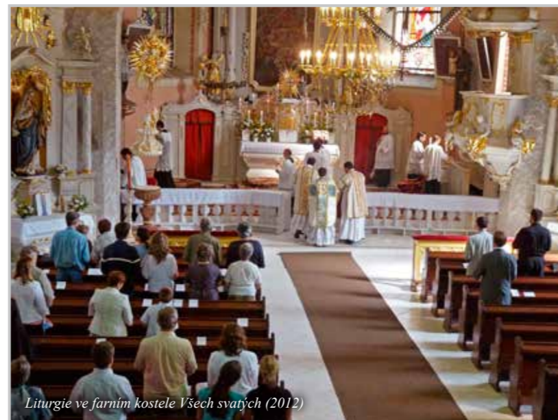
Liturgie ve farním kostele Všechny svatých (2012)