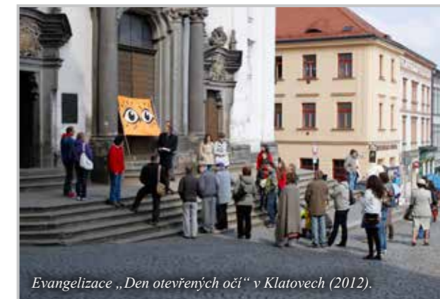
Evangelizace „Den otevřených očí“ v Klatovech (2012)