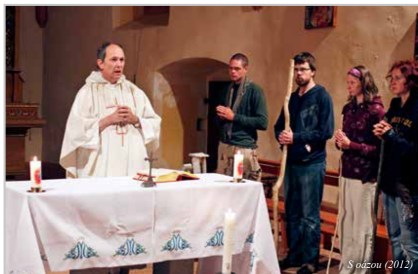
S oázou (2012)

Každý z nás máme svůj úsek, nějaké pole evangelizace, kde to, že se tam bude evangelizovat, je vyslovené na nás. A když tuto povinnost nesplníme, tak z toho jsou důsledky, bohužel, docela vážné: problémy a bolesti pro lidi okolo nás, kterým jsme evangelium dát měli a nedali. Jsou situace a místa, ve kterých by se člověk z vlastní zodpovědnosti hlásat evangelium prostě vyvléknout a házet to na někoho jiného neměl. Rodina, pracoviště, obec.