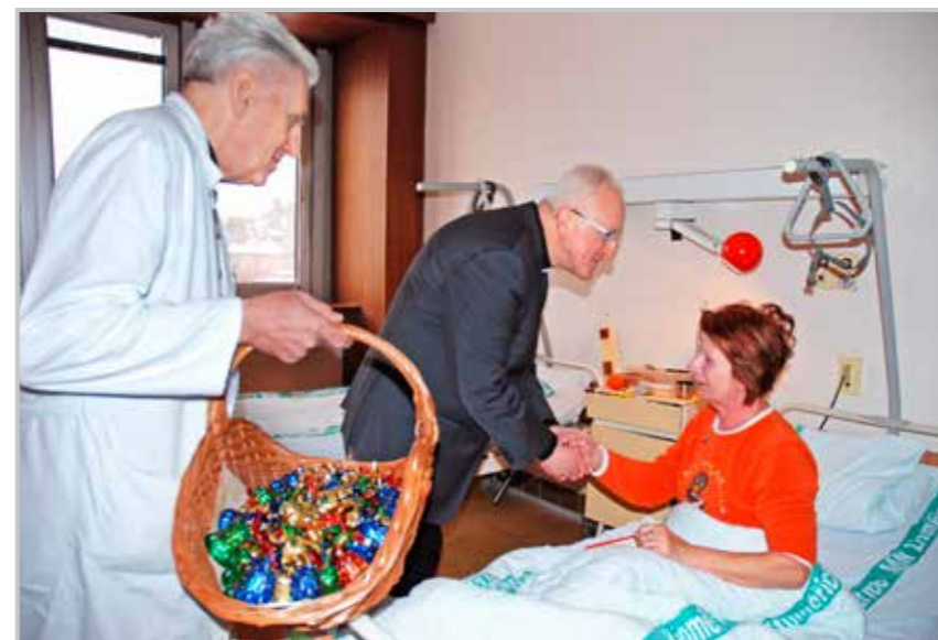
Litoměřický biskup Jan Baxant navštívil na Štědrý den pacienty a personál litoměřické nemocnice.

Vše, co bude zasláno nad rámec této částky, bude považováno za finanční dar určený na pokrytí nákladů spojených s vydáváním tohoto časopisu. Na tento dar je možné vystavit na základě žádosti dárcе potvrzení o poskytnutí daru církevní právnické osobě.