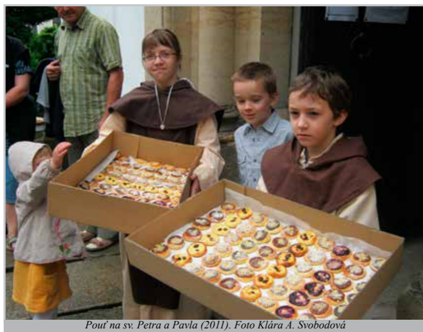
Poutí na sv. Petra a Pavla (2011).

Semilané je slávi v přírodě za městem, nedaleko, aby se dalo dojít pěšky. Dříve se jezdilo ke Královně hor na blízký Bozkov. Předloni byla májová „u Rozárky“, na místě komunisty rozebrané kapličky sv. Rosálie, kde lidé dobré vůle (údajně nevěřící) postavili kříž s obrázkem. Přišlo sedm desítek lidí, po pobožnosti se pekly buřty.