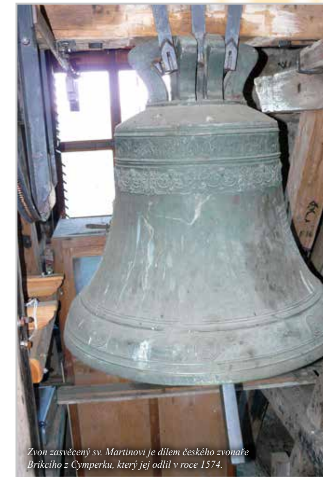
Zvon zasvěcený sv. Martinovi je dílem českého zvonáře Brikciho z Cymperku, který jej odlil v roce 1574.

Radek Rejšek, diecézní kampanolog a organolog