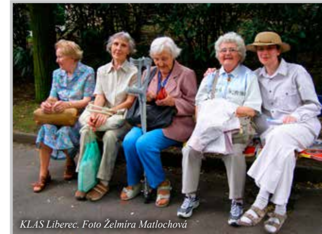
KLAS Liberec.

V Libereckém kraji jsme zatím takovou první vlašťovkou my na arciděkanství v Liberci, ale už přicházejí žádosti i z dalších farností. V Jablonném v Podještědí funguje nový KLAS od září letošního roku. A jak vznikl? Vypravili jsme se tam s našimi seniory z Liberce na pouť druhý den po svátku svaté Zdislavy. Chtěla jsem vybrat takový termín, kdy tam nebude nával, aby si senioři mohli pouť prožít v klidu. Kdo chce jít na velkou pouť, tak prostě jde, ale starší lidé už většinou takhle nikam nejezdí. Mají problém s chůzí nebo není volné místo na sezení a tak dále. Šli jsme pěšky pěkně pomaloučku z Lvové kolem studánky, s růžencem, mezi krátkými rozhovory jsme si dali i svačinku nebo písničku.