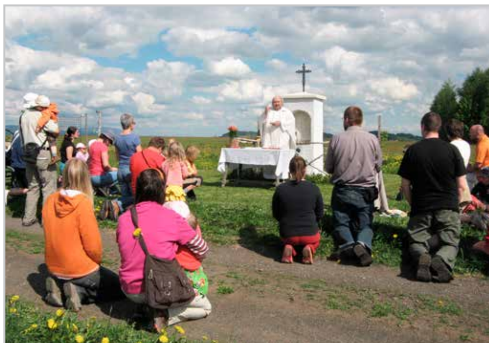
Májová u Benedikta (2012).

Většinu farních akcí provází tzv. semilský efekt, v literatuře zatím nepopsaný, ale R.D. Gajdošíkem spolehlivě vypořizovaný u farníků, kteří se nedostali na určitou akci: „Kdybychom věděli, jak to bude dobré, byli bychom přišli.“ Důstojný pán to ale říká s úsměvem. Je rád, že v jeho farnosti chodí do kostela poměrně dost lidí, z nichž mnozí jsou navíc aktivní: „Není to tak, že bych tady měl nějakou diktaturu: musíte to dělat, udělejte to, aby neřekli, že tady nic neděláme – jednají sami od sebe.“