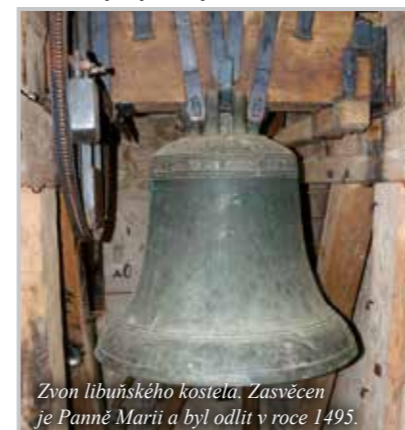
Zvon libušského kostela. Zasvěcen je Panně Marii a byl odlit v roce 1495.

Jedno takové přišlo v létě roku 2012, kdy jsme pro rozhlasovou stanici Český rozhlas 3 - Vltava pořizovali nahrávky vybraných zvonů Českého