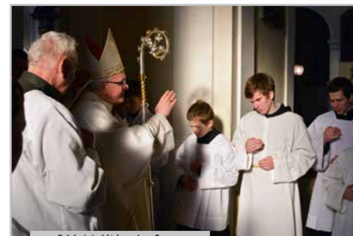
Požehnání od biskupa Jana Baxanta