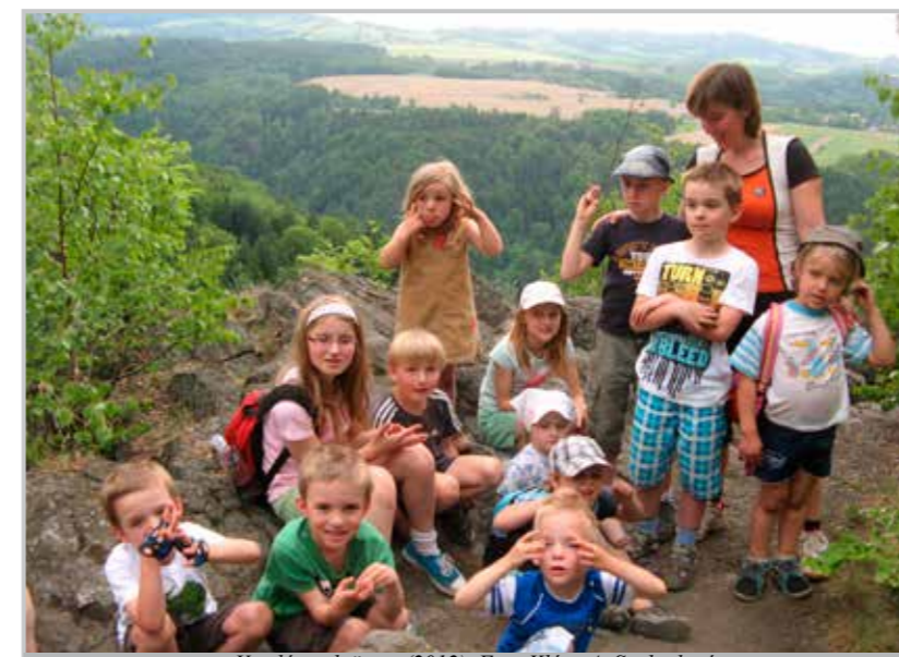
Veselá společnost (2012).