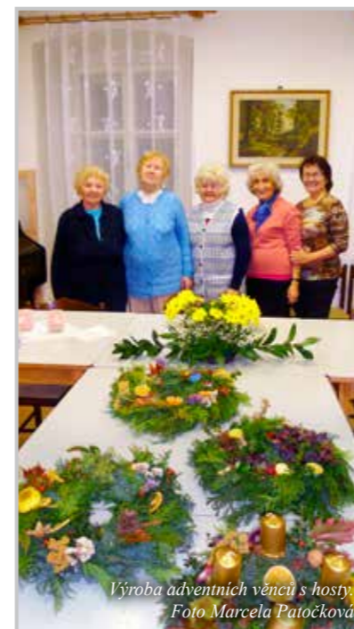
Výroba adventních věnců s hosty.

Na KLASu se mně osobně nejvíce líbí, že je pestrý. Pro toho, kdo má potřeby duchovního rázu, je tam prostor pro modlitbu i přednášky s křesťanským zaměřením. Pro toho, kdo se chce jinak vzdělávat, existují další možnosti. Teď máme například každý měsíc jednu lékařskou přednášku. Paleta činností je široká, takže ten, kdo není dobrý v luštění křížovek, rébusů nebo v matematických cvičeních, se najde v něčem jiném. Děláme i rukodělné práce. Každý si může najít něco, co ho zajímá a baví. Proto, že se jedná o společenství, které se pravidel-