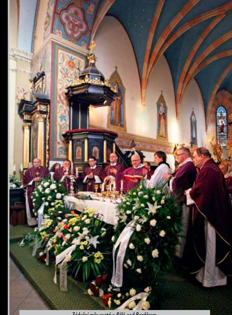
Zádušní mše svatá v Bělé pod Bezdězem.