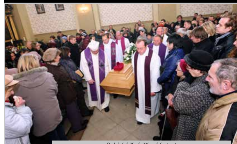
Poslední služba kněží spoluprátoři.