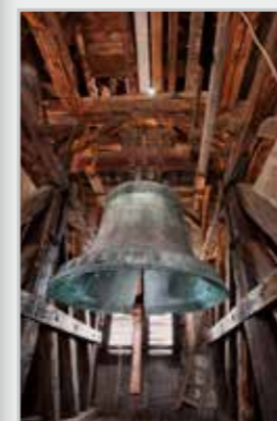
Fotografie na titulní straně časopisu: Zvonice kostela Povýšení sv. Kříže v Kadani

Fotografie bez uvedení autora Jana Michálová a Miroslav Zelenka