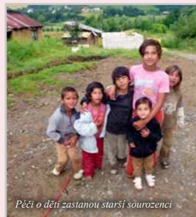
Pěči o děti zastanou starší sourozenci

Malá osada, ležící poblíž obce Kojatice v okrese Prešov (Košický kraj, Slovensko). K trvalému pobytu je