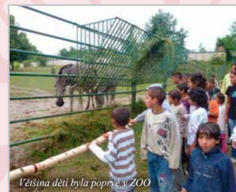
Většina dětí byla poprvé v ZOO

připravených v komunitním centru zahájilo povinnou školní docházku a výsledky jsou jednoznačné. Podle slov třídní učitelky romských žáků první třídy základní školy se úroveň dětí absolujících přípravné vzdělání nedá srovnat s žáky nepřipravenými. Školní zralost dětí zapojených do projektu je podstatně vyšší oproti dětem, které nastupují základní školní docházku bez předchozí přípravy. „Nejen že se na rozdíl od nepřipravených dětí dorozumí slovensky, ale dokáží relativně soustředěně a organizovaně pracovat, poznají základní barvy, ovládají správné držení psacího náčiní, základní společenské návyky a mají elementární poznatky o světě lidí, kultury a přírody,“ dodává učitelka ZŠ Kojatice. Vzhledem k výše zmiňovaným okolnostem pak děti lépe zvládají nástup do základní školy a rozdíl mezi romskými a neromskými žáky jsou tedy znatelně redukovány.